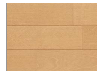
●エクセルナチュラル色