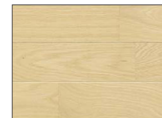
●エクセルライト色