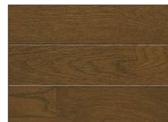
●エクセルダーク色