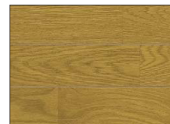
●エクセルミディアム色